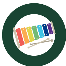
ESTIMULACIÓN MUSICAL TEMPRANA