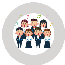
CORO Y CANTO